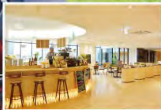
オレンジブーツ店内