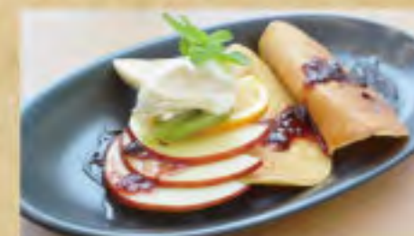
完熟はちみつのパンケーキ