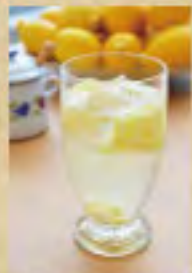
はちみつレモンソーダ