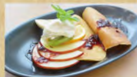
完熟はちみつのパンケーキ