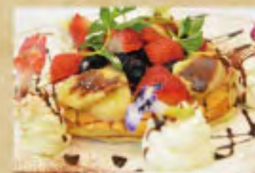
完熟はちみつのパンケーキ