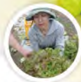
佐久穂町「GOLDEN GREEN」さんの 農薬不使用野菜を使った旬のサラダ